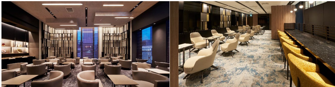
左：銀座プレミアムラウンジ 右：大阪梅田プレミアムラウンジ